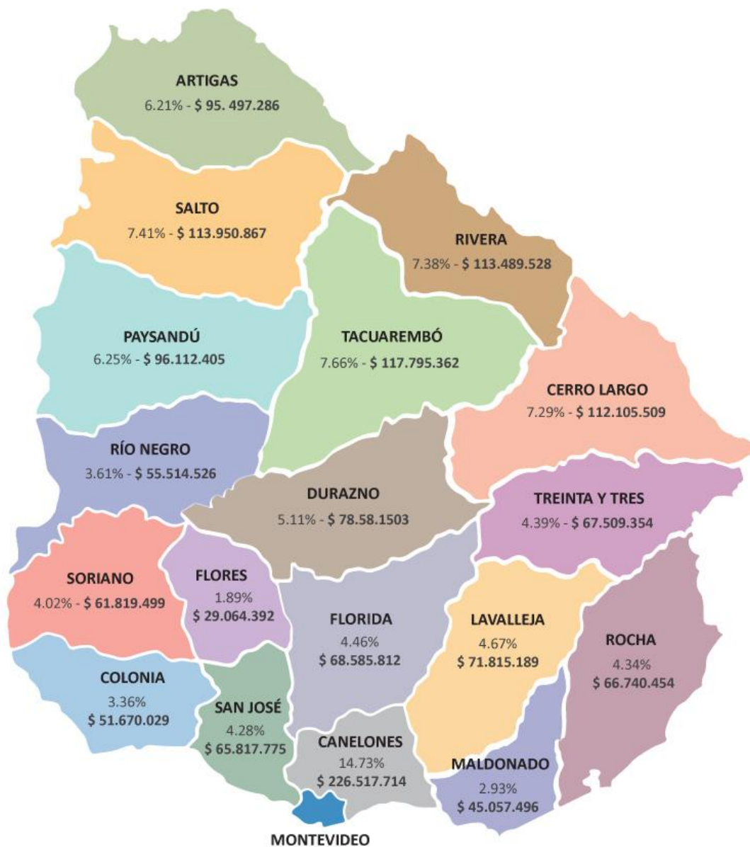
Grafico 2.- Créditos presupuestales 2019 por departamento con cargo al FDI

De acuerdo con lo establecido en el Decreto 411 del 23 de octubre de 2001, la distribución del Fondo de Desarrollo del Interior a ser ejecutado por los GG.DD. se realiza tomando en cuenta los criterios de superficie, población, inversa del Producto Bruto Interno por habitante y porcentaje de hogares con carencias en las condiciones de vivienda, establecidos en el artículo 642º de la Ley Nº 17.296, corregidos en proporción al total de departamentos del Interior.