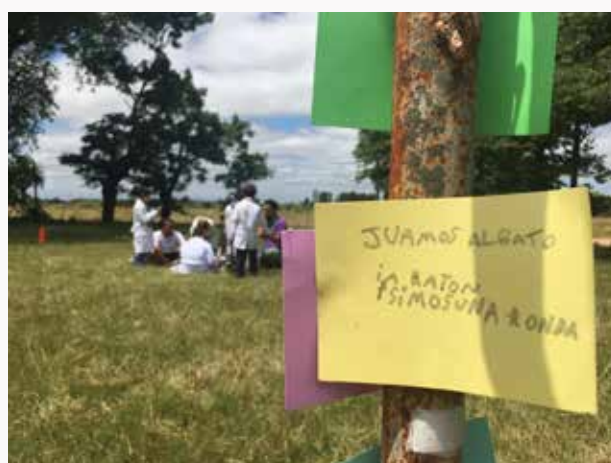
Actividades desarrolladas por La Mancha con escolares en el marco del proyecto “Municipios que cuidan. Pueblos que cuidan” en Aguas Corrientes, Canelones.

De este modo representan un desafío en términos de su construcción y sostenimiento que requerirá del apoyo de las instituciones involucradas en estos procesos. Tanto las intendencias como los municipios, sumados a la sociedad civil y al SNC. Asimismo, es fundamental el involucramiento comunitario en la implementación de estas iniciativas.