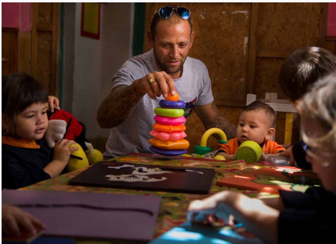
Trabajo en un Jardín a través de becas de inclusión socioeducativa en Florida.

organizaciones locales, instalación de dispositivos, proyectos o acciones de cuidados y acciones que contribuyan a la sensibilización e información respecto al Sistema Nacional Integrado de Cuidados en pequeñas localidades.