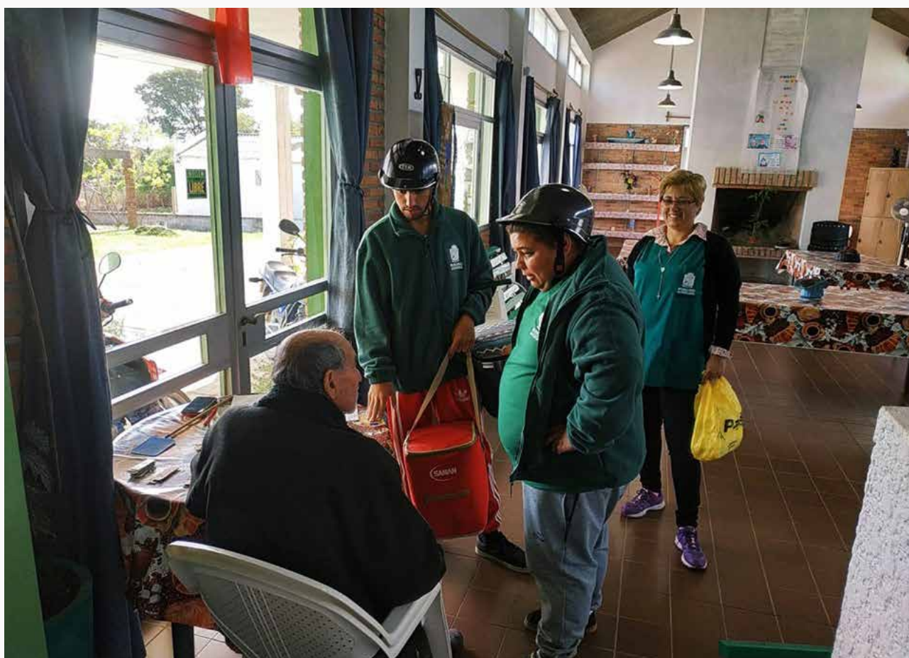
Actividades de cuidados desarrolladas en el marco del proyecto “Municipios que cuidan. Pueblos que cuidan” en Vergara, Treinta y Tres.

talleres mantenidos con habitantes de las localidades, las distintas instancias de los gobiernos subnacionales, organizaciones locales tanto estatales como de la sociedad civil, y referentes de SNC y Uruguay Integra.