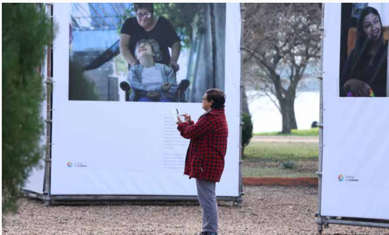
Muestra fotográfica instalada en el marco del proyecto “Municipios que cuidan. Pueblos que cuidan” en Villa Constitución, Salto.

Entre los principales hallazgos pueden destacarse los siguientes; primero en lo que refiere a la primera infancia (niños de 0 a 3 años), según cifras del Censo 2011, este grupo etario representa el 5,3% de la población total del país, lo que equivale a 174.899 personas, de las cuales el 51,2% son varones y el 48,8% son mujeres. La proporción de la población de 0 a 3 años varía de acuerdo a la zona de intervención.