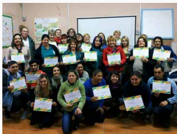
Actividades de capacitación y formación desarrolladas en el marco del proyecto “Municipios que cuidan. Pueblos que cuidan” en Vergara, Treinta y Tres.

Más aún, las instancias de los talleres participativos permiten relevar el desconocimiento existente en estas localidades sobre el sistema de cuidados en particular y del cuidado en tanto derecho, en general. Adicionalmente, estos logran un alcance limitado en lo relativo a trabajar la corresponsabilidad de los cuidados ya que la mayor parte de quienes participan son mujeres (fenómeno que ocurre en prácticamente todas las localidades en las que se trabaja). Lo mismo sucede con aquellas personas interesadas en formarse en temas vinculados a los cuidados, la amplia mayoría son mujeres.