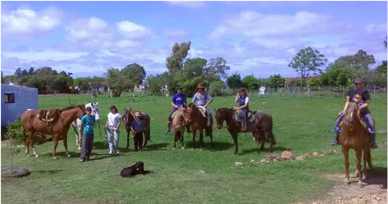
Participantes del proyecto "Cerro de las Cuentas Joven", de Cerro de las Cuentas, Cerro Largo.