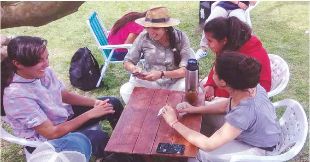
Participantes del proyecto "Cerro de las Cuentas Joven", de Cerro de las Cuentas, Cerro Largo.