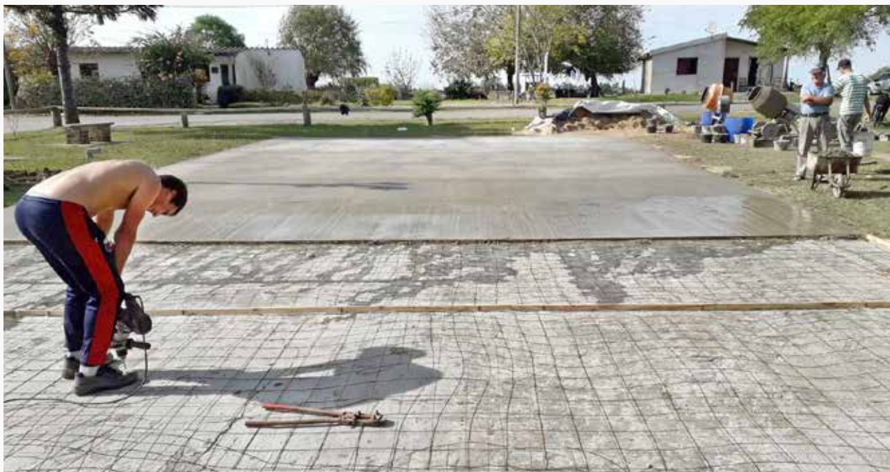
Participantes del proyecto "Jóvenes salón comunal El Semillero", de Semillero, Colonia