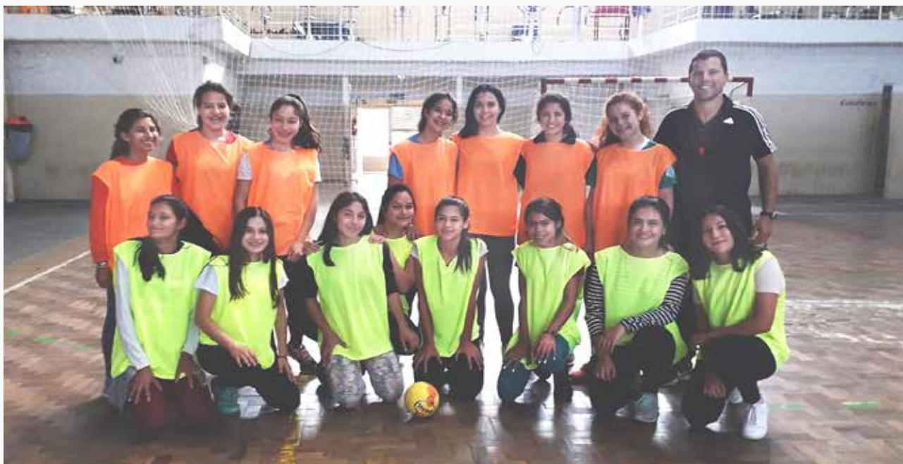
Clase en Tomás Gomensoro, Artigas.

Sin embargo, el eje de género fue identificado como una debilidad por parte de algunos de los docentes, ya que muchos señalaron no haber logrado cumplir con este eje y no haber realizado actividades en este sentido -a pesar de que el proyecto las preveía. Esta debilidad, se analizó en la evaluación presencial realizada, concluyéndose de manera colectiva que sí se realizaron acciones, aunque acotadas y concretas en función a los conocimientos y posibilidades de cada docente, que se entienden como insuficientes, valorándose la importancia y necesidad de recibir talleres para toda la comunidad llevados adelante por personas idóneas en el tema. En esta misma línea, cabe evaluar la participación de los varones adolescentes, así como también de mujeres adultas, a partir de una modalidad que sea proyectada e impulsada por el grupo de adolescentes de modo tal de integrárselos a la propuesta sin perder el eje del proyecto en relación a mejorar la inequidad de género existente en la práctica deportiva, así como promover un cambio cultural en ese sentido.