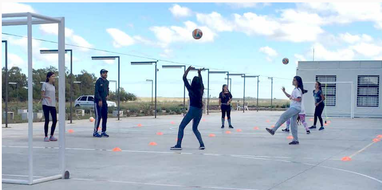
Participantes del proyecto "Jugamos Todas" en Sequeira, Artigas.