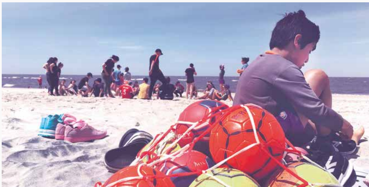
Participantes del proyecto "Jugamos Todas" en el marco de los encuentros regionales.

La mayoría de los docentes (14 de los 16 consultados) señalan implementar estrategias para fomentar la participación en aquellos casos en los que las participantes dejaban de concurrir a las escuelas deportivas por algún motivo. Entre ellas se destacan particularmente acciones tales como llamar a la casa de las adolescentes que no concurrieron, consultar a sus compañeras sobre el motivo de la inasistencia e intentar motivarlas a través de cambios en la currícula y realización de actividades de integración luego de las clases. Un docente explicaba "dialogaba para saber los motivos de su abandono a clases, realizaba meriendas compartidas para fortalecer la unión y el compañerismo del grupo" .