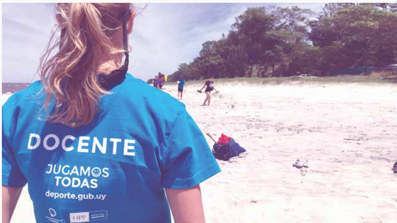
Docente del proyecto "Jugamos Todas" en el marco de los encuentros regionales.