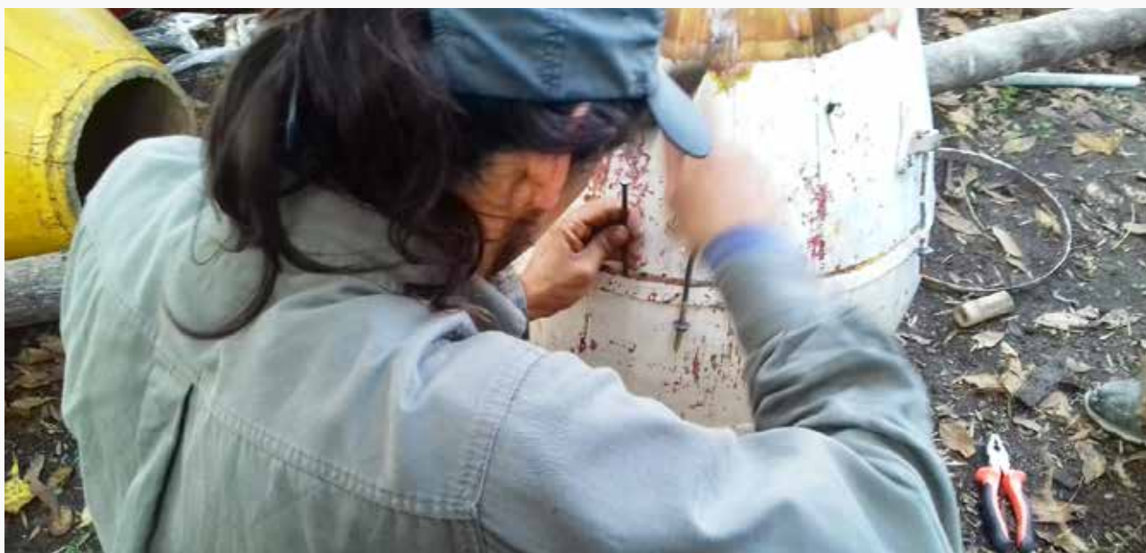
Participantes del proyecto "Candome Agua", de Aiguá, Maldonado