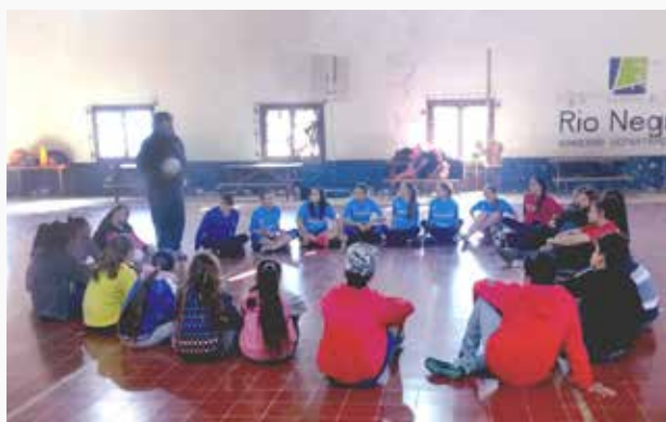
Participantes del proyecto "Jugamos Todas" en Nuevo Berlín, Río Negro.

De hecho, 9 de los 10 docentes que trabajaron en sus intervenciones con varones, recomiendan la incorporación de estos a todos los proyectos de "Jugamos Todas" en el futuro. Esto corresponderá ser evaluado de cara a una segunda edición por parte del equipo técnico en lo que respecta al diseño del proyecto, no sólo en términos de resguardar el objetivo del proyecto asociado a género y deporte, sino también porque corresponde tener en cuenta la visión de las propias beneficiarias, quienes en ocasiones habrían señalado que la incorporación de los varones resultaba en que sentían su espacio invadido, que los varones jugaban fuerte y que no les compartían el juego.