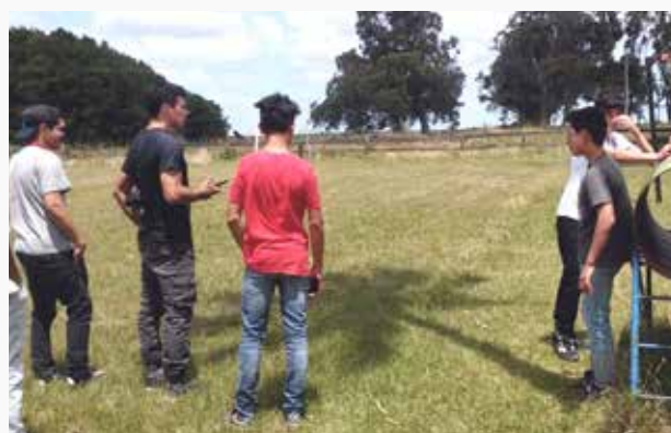
Participantes del proyecto "Zapata", de Arrocería Zapata, Treinta y Tres

Las 42 propuestas seleccionadas inicialmente para recibir el financiamiento y el apoyo técnico del fondo son muy diversas; tanto en lo que refiere a los proyectos y temáticas a trabajar, así como a su despliegue territorial. En este sentido, las iniciativas provienen de colectivos de jóvenes de 17 departamentos diferentes, y de 39 localidades pequeñas del país.