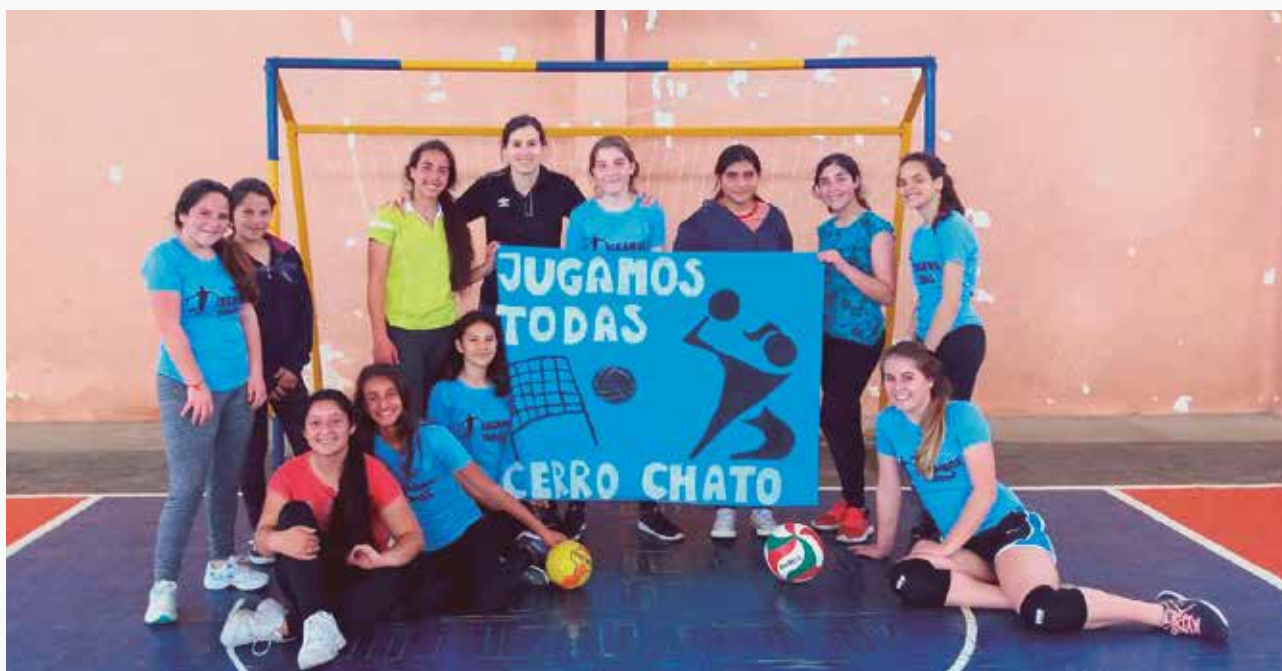
Participantes del proyecto "Jugamos Todas" en Cerro Chato, Treinta y Tres.