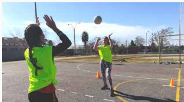
Participantes del proyecto "Jugamos Todas" en 25 de Mayo, Florida.