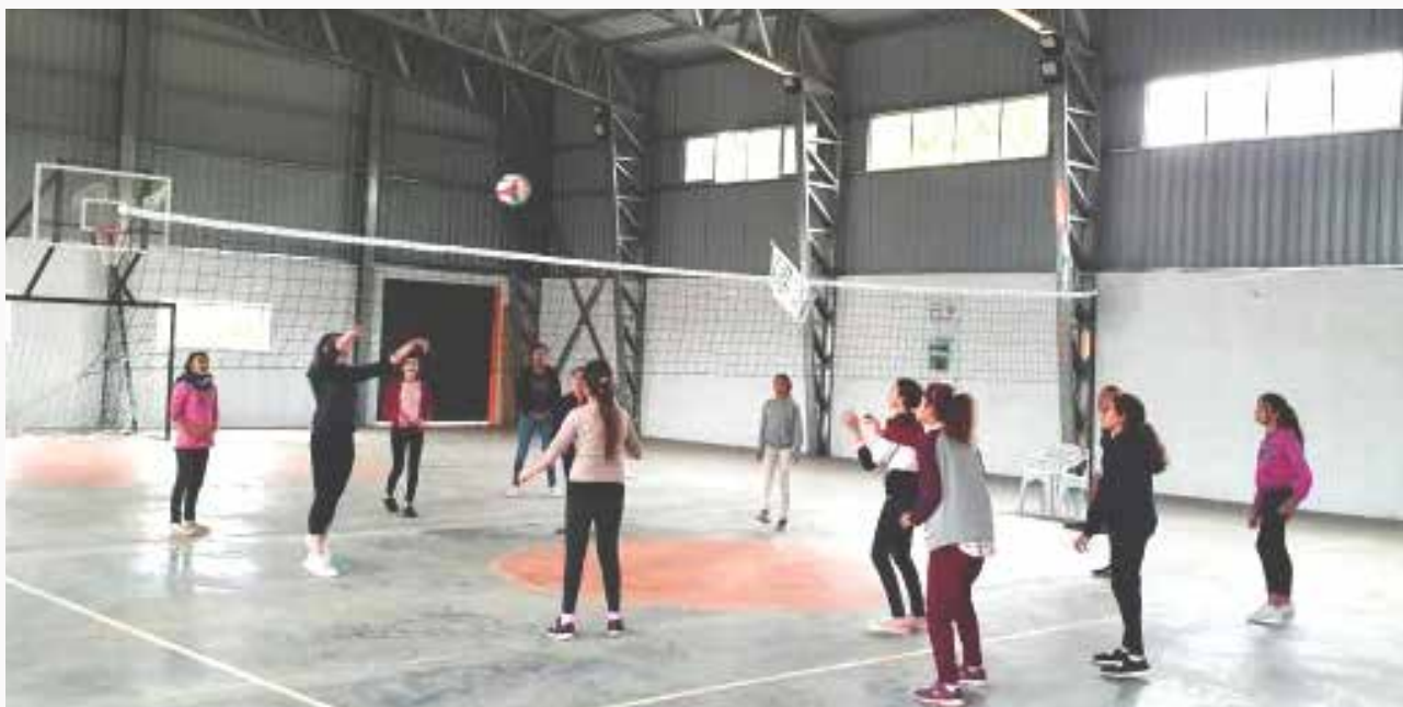
Clase de vóleybol en La Paloma, Durazno.

La ejecución de “ Jugamos Todas ” y su posterior evaluación permite entrever algunos aspectos sobre los que podría trabajarse y potencialmente tomar nuevas definiciones de cara a una siguiente edición del proyecto. En este sentido, se podrían revisar algunos aspectos del diseño –en base a las sugerencias de los docentes- relativos a la posibilidad de ampliar la oferta deportiva de estas escuelas (ofreciendo otros deportes más allá de voleibol y hándbol), así como la posibilidad de reconsiderar y reorganizar la frecuencia y los días de funcionamiento de las mismas. Asimismo, se debería profundizar en los mecanismos de convocatoria y difusión del proyecto, posibilitando así ampliar el número de beneficiarias.