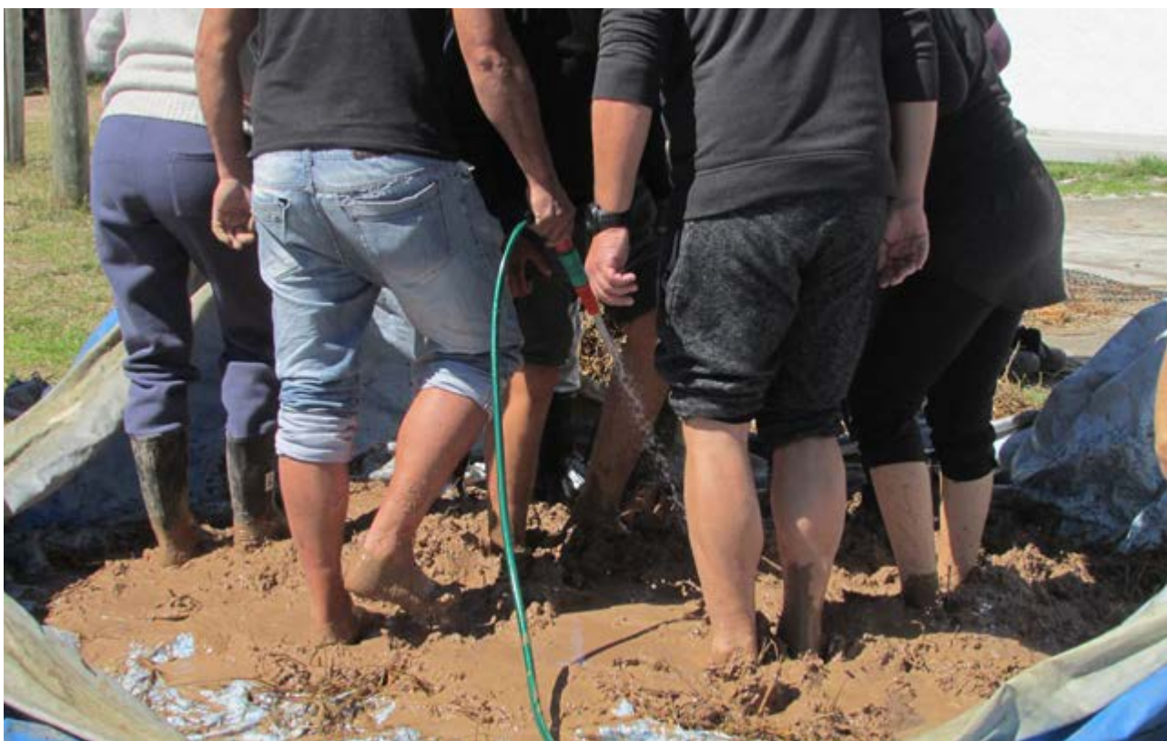
FIL Ciudad de la Costa - Solymar. Iniciativa “Punto de encuentro social-ecológico”

Se espera que los municipios que llevaron adelante esta primera experiencia FIL puedan continuar con futuras ediciones mejoradas, con fondos propios, compartidos con las intendencias u otras formas de financiamiento.