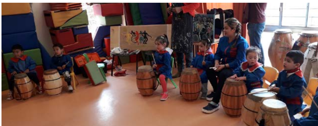
FIL Toledo. Cultura de integración – Ciclo de Vida. CAIF Nuestros Locos Bajitos.

El siguiente paso fue construir una agenda de reuniones con cada municipio seleccionado para diseñar la estrategia en particular. En este proceso