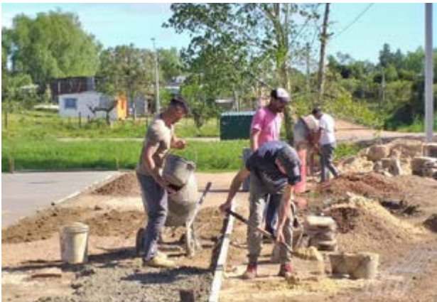
FIL Pando. Iniciativa “Tod@s por la placita de la Unión”

Casi todos los municipios incorporaron en sus reglamentos que los fondos se transferían en dos mitades: una con la firma del convenio y otra contra la rendición de cuentas de la primera. Esta modalidad, si bien podía generar problemas en algunos casos, le garantizaba al municipio la posibilidad de proseguir la ejecución y de controlar que los fondos efectivamente se utilizaran para los fines acordados. En el caso de Toledo se efectuaron tres transferencias en lugar de dos.