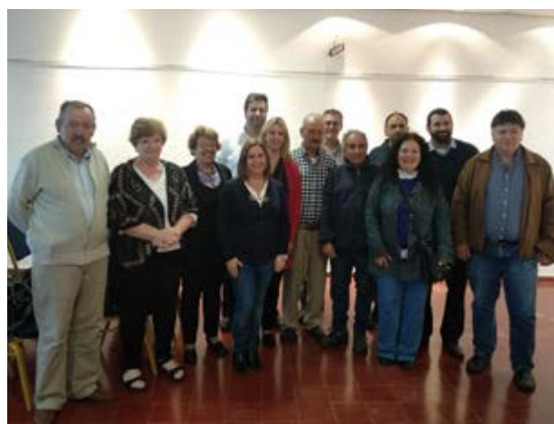
FIL Pan de Azúcar. Jornada de firma de convenios con organizaciones sociales.

El fondo se financia a través del monto que propone el municipio, el cual es tomado como el 25 % del total, y OPP financia el equivalente al 75 %. Se trató de un mecanismo novedoso: la iniciativa de financiamiento la tenía el municipio, que veía multiplicado su aporte por cuatro. O sea, el municipio que asignaba mayor cantidad de recursos conformaba un fondo también mayor.