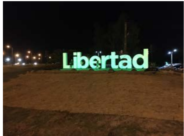
FIL Libertad. Inauguración de Iniciativa Letras de la ciudad “Espacio entre Rutas”

La mayoría de las iniciativas se cerraron entre noviembre y diciembre, con la inauguración de espacios, la realización de actividades y la presentación del trabajo realizado.