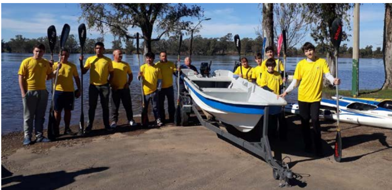
FIL Paso de los Toros. Equipamiento de Escuela de Canotaje. Club Atlético Libertad

El siguiente cuadro sintetiza por Departamento y Municipio la información de cada iniciativa aprobada y ejecutada, así como la organización civil y los montos aprobados: