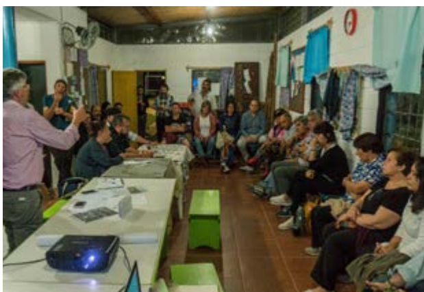
FIL Las Piedras. Taller de proyectos.

jores políticas de cercanía con las organizaciones del territorio. Se trata de un mecanismo de participación y forma de trabajo que logra resultados en los tiempos esperados, que genera nuevos vínculos y alianzas y que demuestra que es posible implementar fondos en clave participativa y con mecanismos de intervención público-privados.