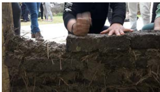
FIL Nicolich. Iniciativa "Atrapasueños" _Taller de Bio-construcción

Los FIL se posicionan como una experiencia que ha logrado contribuir en el proceso de legitimación de la participación para la propia población. Se trata de iniciativas que en términos generales logran seguir un cronograma, que demuestran que es posible alcanzar las metas y que evitan el desgaste por parte de la sociedad civil.