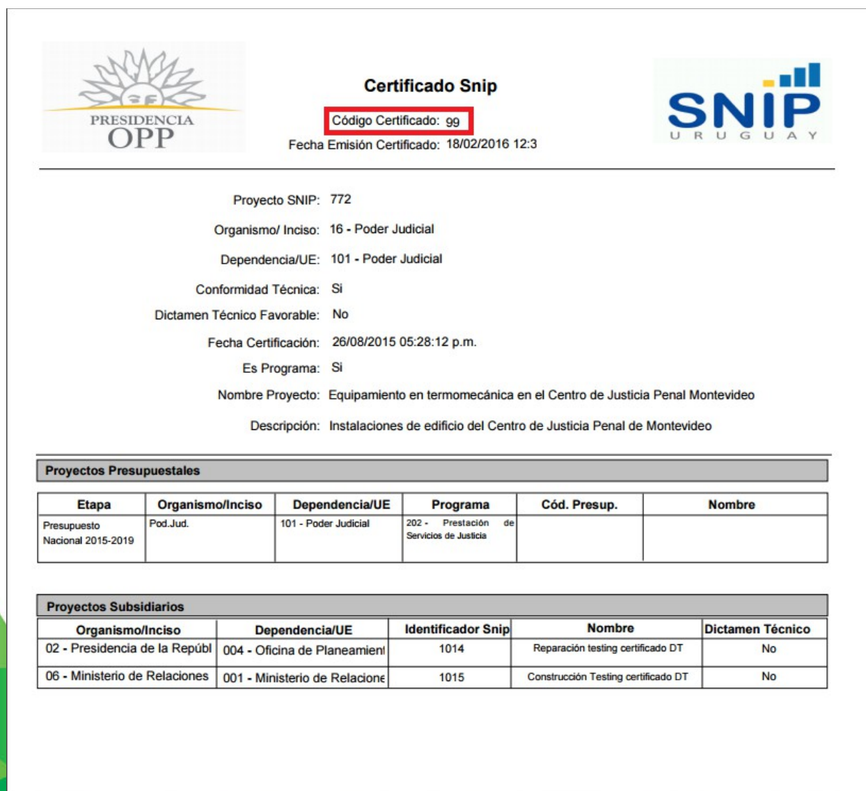
Ilustración 6: Certificado de Dictamen Técnico SNIP

Una vez generado el Certificado de Dictamen Técnico SNIP; este presentará un “código de Certificado” que se ubica en la parte superior del mismo y será el utilizado para la consulta.