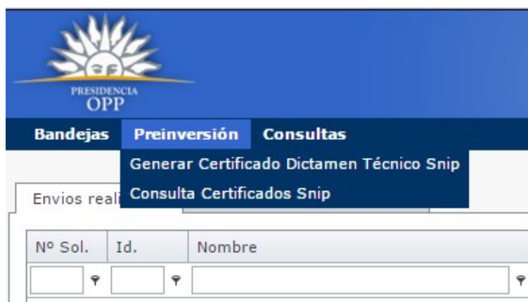
Ilustración 7: Opción de Menú

Para poder consultar el Certificado SNIP se deberá seleccionar la opción de menú “Preinversión” y dentro de la misma la opción “Consulta Certificados Snip” como se muestra en la imagen siguiente.