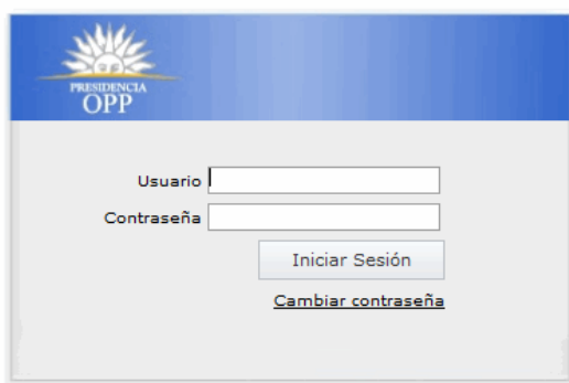
Ilustración 1: Inicio sesión

Para acceder al Banco de Proyectos primero ingresar al navegador de Internet que tenga instalado el equipo (puede ser Internet Explorer, Firefox, Chrome; sin embargo se recomienda Chrome) y se mostrará la siguiente pantalla: