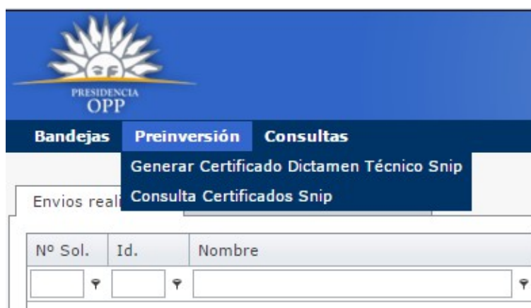
Ilustración 3: Opción de Menu

Para poder generar el Certificado SNIP se deberá seleccionar la opción de menú “Preinversión” y dentro de la misma la opción “Generar Certificado Dictamen Técnico Snip” como se muestra en la imagen siguiente.