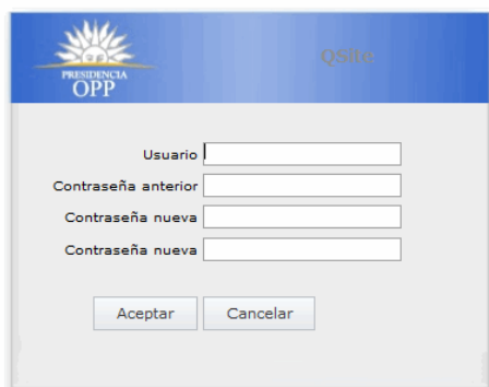
Ilustración 2: Cambio de contraseña

Para cambiar la contraseña se exige el ingreso de la contraseña anterior y el ingreso de la nueva contraseña, para finalizar deberá hacer clic en “Aceptar”.